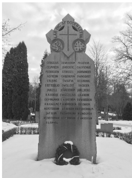
Lär dig af döden lefva. Nationsgraven i vinterskrud.

tillkomst var från början i högre grad dikterad av rent praktiska överväganden; det var inte så sällsynt att studenter avled på studieorten, och transport till hembygden kunde vara både dyr och opraktisk.