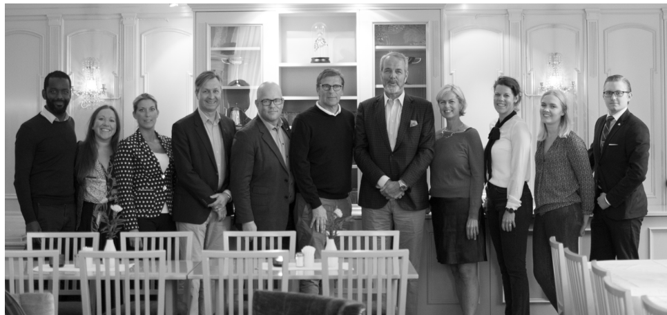
Seniorföreningens styrelse 2016/2017 firar att ännu ett verksamhetsår är till ända.