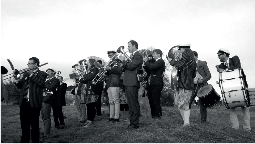
1 maj innebär kottkrig vid Polacksbacken. Efter striden förenas de forna fienderna i en dans till tonerna av "H:B".

att träffa människor med olika politisk, sexuell, akademisk och inte minst musikalisk bakgrund. På senare tid har vår nation även berikats med människor inte bara från Södermanland och Närke, utan från hela världen. Till vår förening har det strömmat duktiga musiker från bland annat USA, Kina, Australien och Italien – och kanske framför allt från Tyskland. Mustigt. Och när vi tillsammans sitter där med våra instrument så talar vi alla samma språk och rör oss i samma riktning. Där ingår vi alla i en gemenskap, vi är alla från samma nation och vi gör det som en förening gör bäst: förenar.