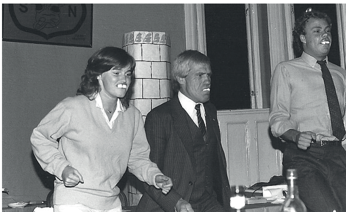
Företrädare för tre sektioner visar prov på HOA med betoning på Omdöme.

Handen över hjärtat hade inget samband med framförandet av någon nationalhymn utan var en del i koreografin när kupletten "Tvä kåcka glada gossar" (av Östen Warnebring och Cornelis Vreeswijk) travesterades.