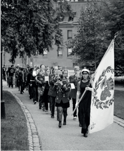
Hornboskapen, givna vid alla högtider, baler och mottagningar. Här vid recensionsmottagningen bösten 2014.

som vi varit en liten del av även berikat andras. Till exempel de sju damer med trätänder i Karksi-Nuia (en liten grå by i Estland), som i morgonens dis hade bänkat sig bredvid den rysksponsrade bensinmackens brummande pumpar för att avnjuta Hornboskapens välljudande dagen-efter-toner. Den glädje som musiken förmedlade den dagen 2013 kommer alla som var med för alltid att komma ihåg. Den glädjen är äkta. Det är samma glädje som suddar ut ålderskillnader när redan utexaminerade studenter i åldersspannet 25–103 återkommer till nationen för att under några timmar tillsammans skapa glädje. Under de