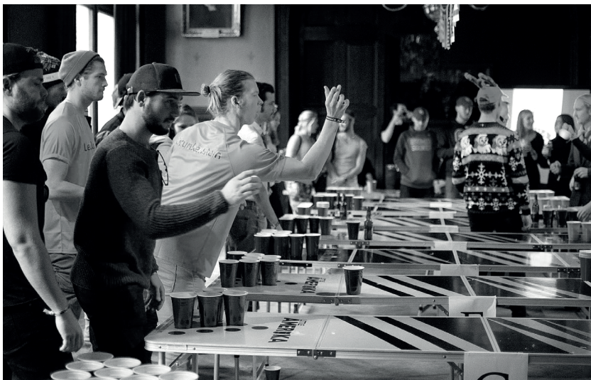
Beer pong har blivit ett återkommande tävlingsinslag i verksamhetsåret, till mångaas glädje.

ju närmare premiären vi kommer desto fler personer kan du höra vissla Rapps kupletter eller öva stämmorna på Hell dig, du Madagaskar. I samband med lördagens föreställning bjuder nationen in till en Madagasque, en kväll helt i På Madagaskars ära. I skrivande stund är alla biljetter slutsålda och jag ser fram emot premiären. Om uppsättningen och gasquen får du läsa i nästa Majhälsning.