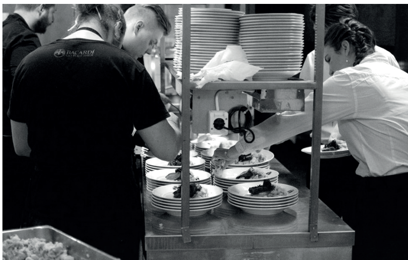
Nationen har under året bland annat investerat i en ny servis som säkrar högklassiga gasquer även i framtiden.

I mitten av terminen drog restaurangverksamheten igång tillsammans med all annan verksamhet och snabbt var det lugn som kvarteret hade fått uppleva under