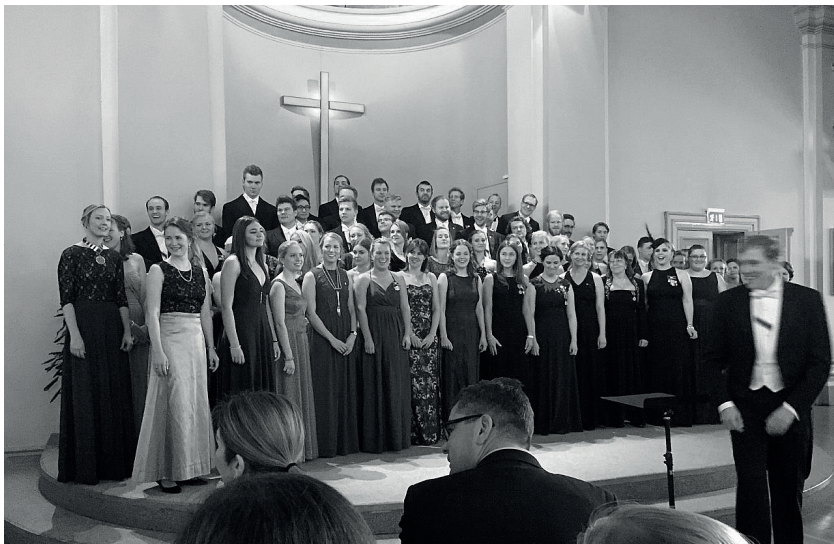
Kören sjunger inte bara på Nationens egna sittningar och arrangemang. Här ett uppträdande tillsammans med delar av Seniorkören, hösten 2016 i Baptistkyrkan i Uppsala.

Ovanstående lilla exposé kan ju uppfattas som helt meningslös, som ren gallimatias och oförskämt