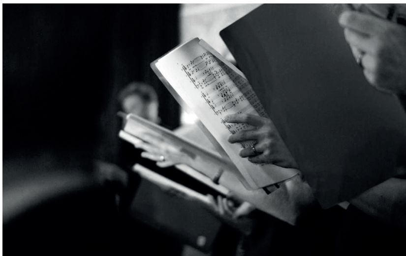
Under måndagskvällarna fylls festsalen av ljva toner när kören repeterar.

Oavsett hur bra man mår av att sjunga i kör, oavsett knasiga upplevelser, den goda känslan av att tillhöra ett sammanhang, glädjen att få vädra stämbanden en gång i veckan, sjunga på gasquer, ordna konserter och fester, så finns det något mer som blir så tydligt när funderingarna till sist letat sig ut ur minnenas labyrint och istället blivit till eftertanke. Det som kommer ut och som stannar kvar, det som känns dyrbart och heligt är vänskap!