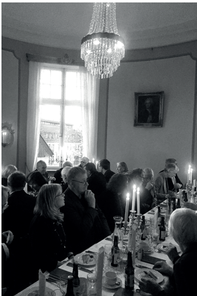
Delblancsällskapet vid årsmiddagen som hölls i Gustavianska salongen i mars 2017.

kulturhistoria. Nationen har sett många betydelsefulla personer komma och gå, och tyvärr börjar de bli allt för många för att rymmas i vår aktiva minnesbank. Därför är det viktigt att värna om litterära sällskap, som hjälper oss att minnas vår egen historia. De möjliggör umgänge över generationsgränserna och hjälper oss att fylla i de minnesluckor som tiden för med sig. Genom att ta del av glimtarna i Minnesbilder blir en sak särskilt tydlig: nationen, då som nu, präglas av engagemang, humor, högtidlighet och kamratskap. Som-