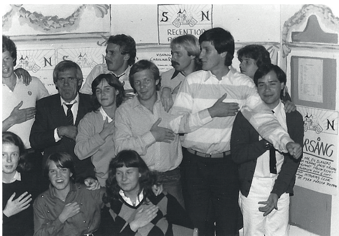
Alla sektioner på plats i Tornrummet för att "stärka psykiska välbefinnandet".

Den något äldre mannen, "Knatten", var inte recentior utan tränare för fotbollslaget.