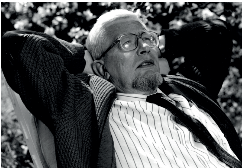
Sven Delblanc.

Liksom vi på nationen önskar att nya generationer tar del av vår gemenskap är det också viktigt att nationen i sig tar del av sin egen