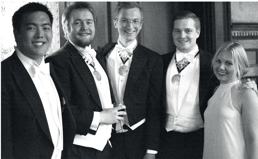
De avgående kuratorerna med sina efterträdare, vid vårbalen 2016. Vilka som var gladdast förtäljer bilden icke.

Det är inte bara Snerikekören och IF Trikadien som fått sina födelsedagar firande. Proinspektor