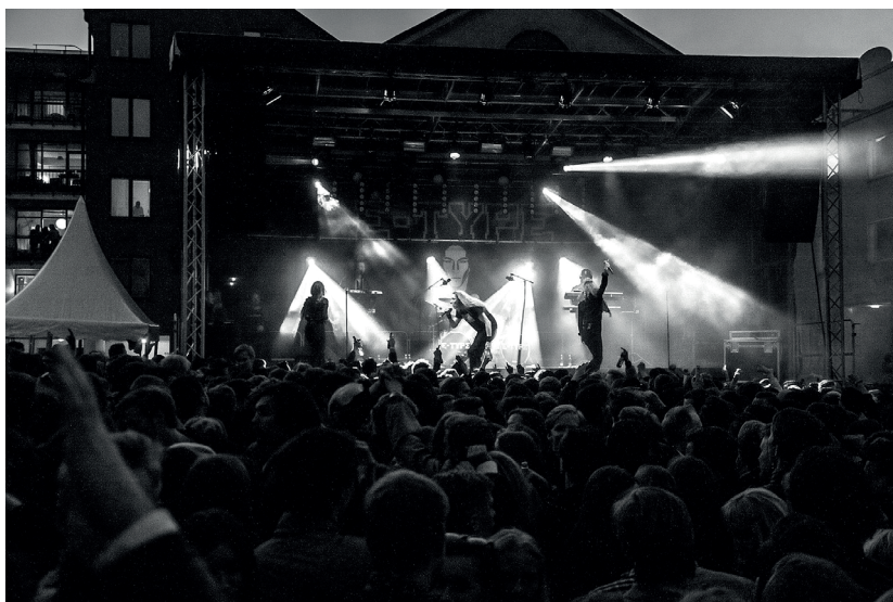
Artisten E-Type gjorde ett bejublat och välbesökt framträdande i nationskvareteret under valborgsbelgen.

Även om många poster har stått tomma har flera nya skapats för att utveckla vår verksamhet och för att ge medlemmar fler vägar till nationsengagemang. Inför våren har en jämställdhetsgrupp tillsatts, med uppgiften att se över hur nationen kan förbättra sitt jämställdhetsarbete. Bland annat har jämställdhetsgruppen skickat ut en enkät till samtliga medlemmar, för att kartlägga hur vårt klubbklimat ser ut, och gjort statistiska analyser över vilket kön som finns representerat mest på olika ämbeten