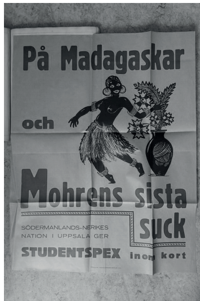
Affisch till en av de många uppsättningar som gjorts av På Madagaskar.