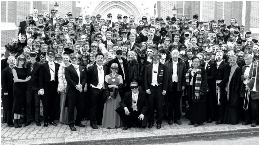
Skottårsbalen, som av förklarliga skäl bara anordnas vart fjärde år, fyllde festsalen med maskprydda deltagare.

Den 11 mars öppnade nationen sina portar och bjöd in till öppet hus, eller Öppet slott som det så fyndigt var benämnt. Med exempelvis en mekanisk tjur i Eskilstunarummet, möjligheter att få prova att både stå i baren och i köket, improvisationsteater med nationsteatern och möjligheten att filosofera med filosofifören-