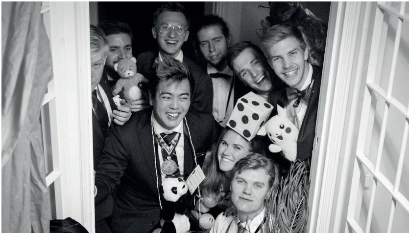
Nationens Alfapethannar fick se tärningar kastas och bokstäver sammanfogas till ord vid nationens herrmiddag.

som stod för större delen av produktionen av spexet blev jubileet inte bara en succé besöksmässigt med tre slutsålda föreställningar utan även ett fantastiskt projekt där olika generationer snerkingar arbetade tillsammans för ett gemensamt projekt. I samband med spexet arrangerades även en jubileumssittning med specialinbjudna gäster och en utställning om spexets historia. Uppsättningen engagerade både aktiva ämbetsmän i sin ämbetsmannautövning och ett antal funktionär, så 150-årsjubileet kan inte beskrivas som något annat än en succé.