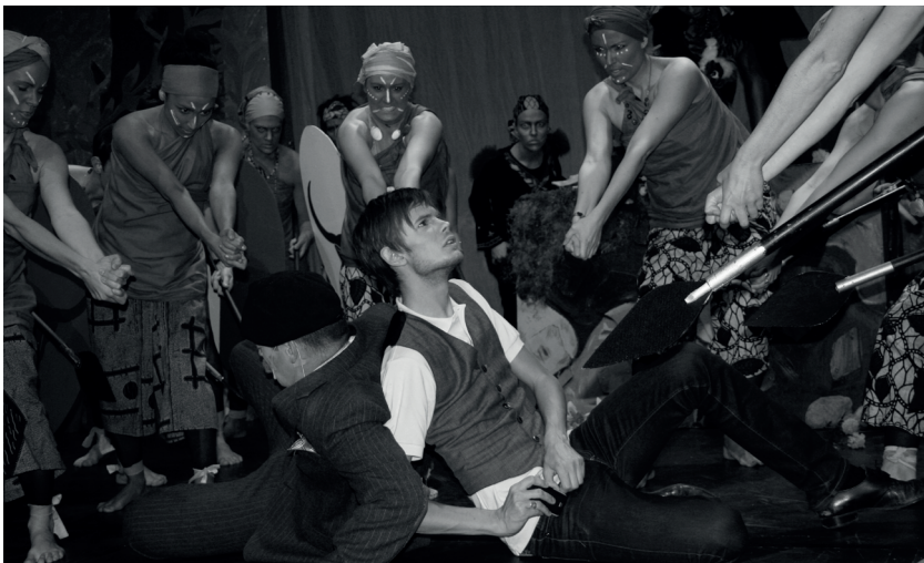
A la Bonneheure och Rapp i knivigt läge under senaste uppsättningen 2007.

på kvällen till föreställningen på Upsala Teater.