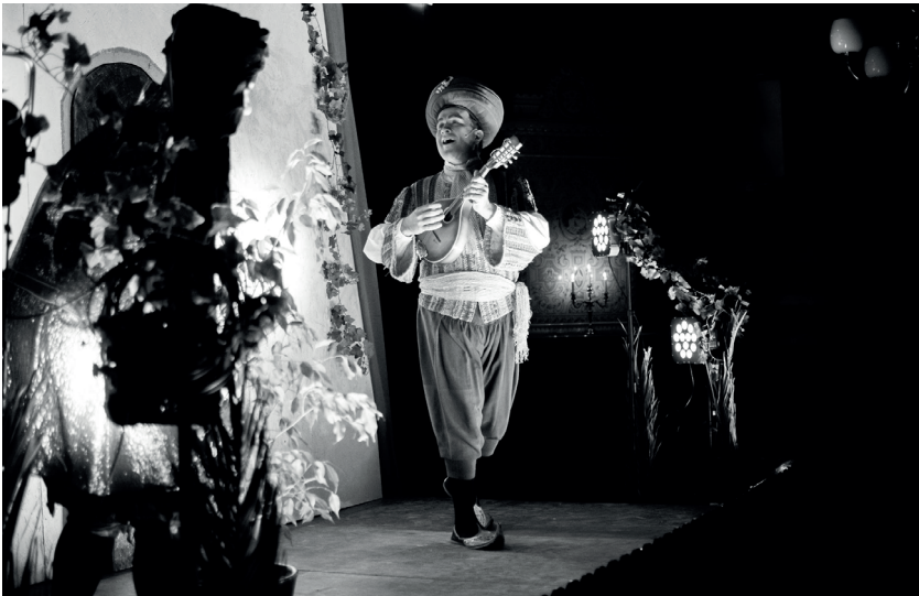
Mustapha uttrycker sina varma känslor i sång. Uppsättningen tog stor historisk hänsyn till både musik och kostym.

Första gången jag hörde talas om Mohren beskrevs den mest som en spännande historia med ett blodigt slut. Men man ska inte underskatta dess dramatiska värde. När spexet sattes upp i Enköping år 1907 var det många som bokstavligt talat greps av handlingen. En äldre dam på första parkett blev så medtagen att hon redan under första akten svimmade och fick bäras ut ur lokalen. Något så dramatiskt hade aldrig tidigare skådats i Enköping. Svårt att tro, kan tyckas, men å andra sidan så