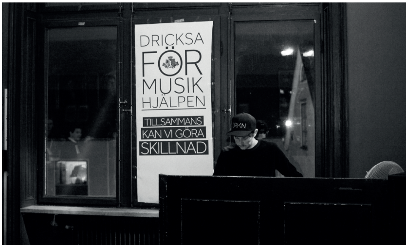
Nationen gjorde återigen en fin insats genom att låta intäkter från klubbverksamheten gå till Musikhjälpen.

Under året arrangerades två donationsklubbar där drinks, entré- och garderobsintäkter och lönen (för dem i personalen som ville) donerades. Musikhjälpen-middagen med Edward Blom som auktionerades ut i december 2014 genomfördes nästan exakt ett år senare i Gustavianska salongen. Under vårterminen samlades 48 Tkr in till Cancerfonden och un-