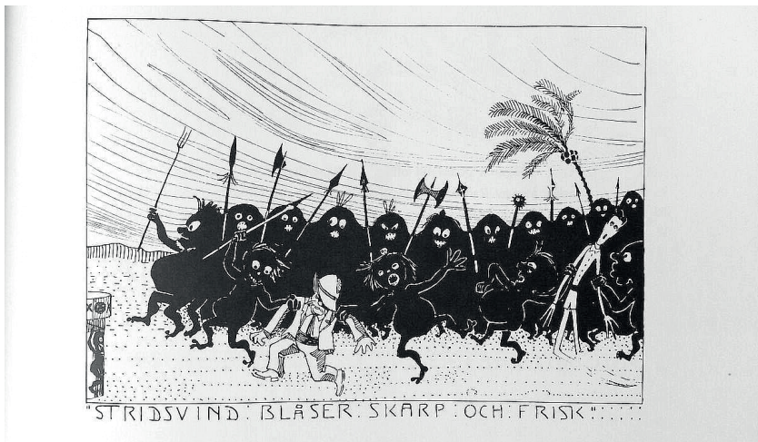
Stridsvind blev många år senare en av nationens ordinarie snapsvisor.

Efter uruppförandet av På Madagaskar kom stycket att vila i elva år. 1880 gav nationen två föreställningar för välgörande ändamål på Upsala Teater (det s.k. ”Château Barowiak”) på Vaksalagatan, lördagen den 4 och tisdagen den 7 december. Som förpjäls gavs August Blanchés komedi Hittebarnet. Tydligt hade tillgången på teatraliska och musikaliska begåvningar vid nationen sjunkit sedan 1870, ty redan i annonserna upplyste man