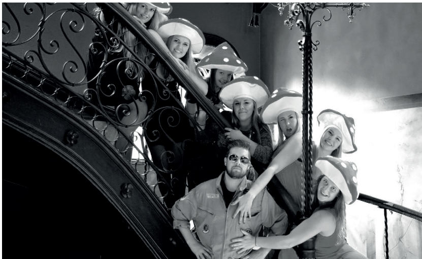
Drivna men prestigelösa lagspelare? Temat för årets damsupé var arbetsförmedling. Och svampar?

Vintern rasade ut i väldig fart och snart var det dags för sedvanligt sista-aprilfirande i dagarna tre. Medan högtidssillunchen höll till i Gustavianska salongen och