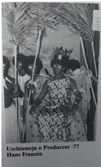
Länge leve ordförande Frasse, tillika drottning Uschiameja årgång 1977. Tarabagata!

år kvar till nästa uppförande av På Madagaskar! Hur kan vi bidra här?