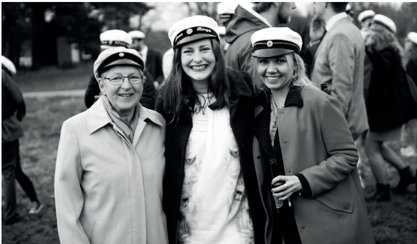
Kottkriget vanns återigen av damlaget genom ett strategiskt samarbete över generationsgränserna.

Det blev tentatider och ferierestaurangen Bryggan tog över driften över nationens restaurang och klubbverksamhet. Under sommaren introducerades ett flertal nya koncept som en asiatisk lounge, stand-up-kvällar och endagsevenemanget Brygganfestivalen som genomfördes i slutet av augusti till intendent Peter Forsgrens smärre förfäran, men till studenternas stora glädje. Uteplatsen smycka-