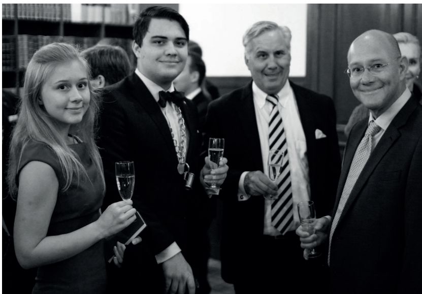
Generationerna möttes under den som alltid fullsatta böstgasquen.