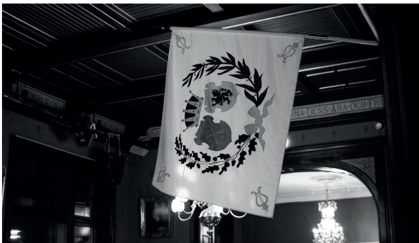
Nationens nya fana på plats i festsalen.

från kvällen till musikhjälpen. Även nationens andra verksamheter såsom kören, Hornboskapen, teatern och helgfikat anordnade tillställningar för att bidra. Vi anordnade även en auktion på Tradera där vi erbjöd en middag med vår hedersledamot Edward Blom på nationen. Det högsta budet landade på otroliga 27 900 kr. Till Musikhjälpen skänkte nationen totalt drygt 102 Tkr.