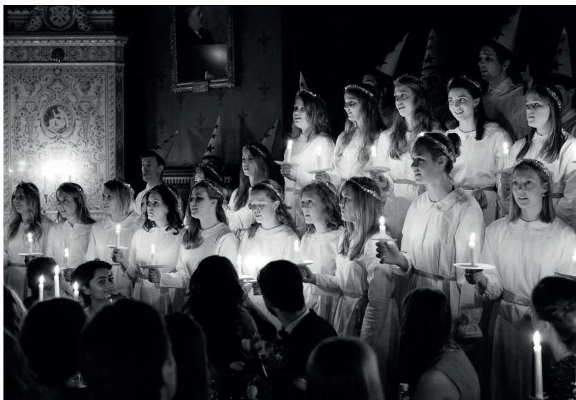
Kören bidrog till julstämningen under luciagasquen. Under kvällen invigdes också nationens nya fana.

I början av december hölls för första gången Radiohjälpens välgörenhetsevenemang Musikhjälpen på Stora torget i Uppsala och nationen sparade inte på krutet för att hjälpa till. Tack vare en enorm arbetsinsats från nationens ämbetsmän, föreningar och medlemmar lyckades Snerikes donera över hundratu-