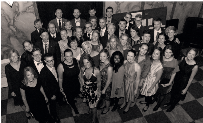
Stor uppslutning av tidigare körmedlemmar vid Seniorföreningens höstgasque.

När mötet är avslutat byts det om till festklädsel och en separat sitt-ning på klassiskt körmanér hålls. Där är allt som förr: Efter några snaps- och vinvisor i ljuvliga stäm-mor hörs sopraner som gärna tar (nästan) höga C, altar som njuter av altstämman som bara altar kan, tenorer som inte förstår dirigen-tens tydliga instruktioner att det är piano på vissa delar av sången och basar som brölar som om de vore från familjen Hedenhös tid. Men ack så roligt vi har det och så vitt jag kan minnas har det alltid varit