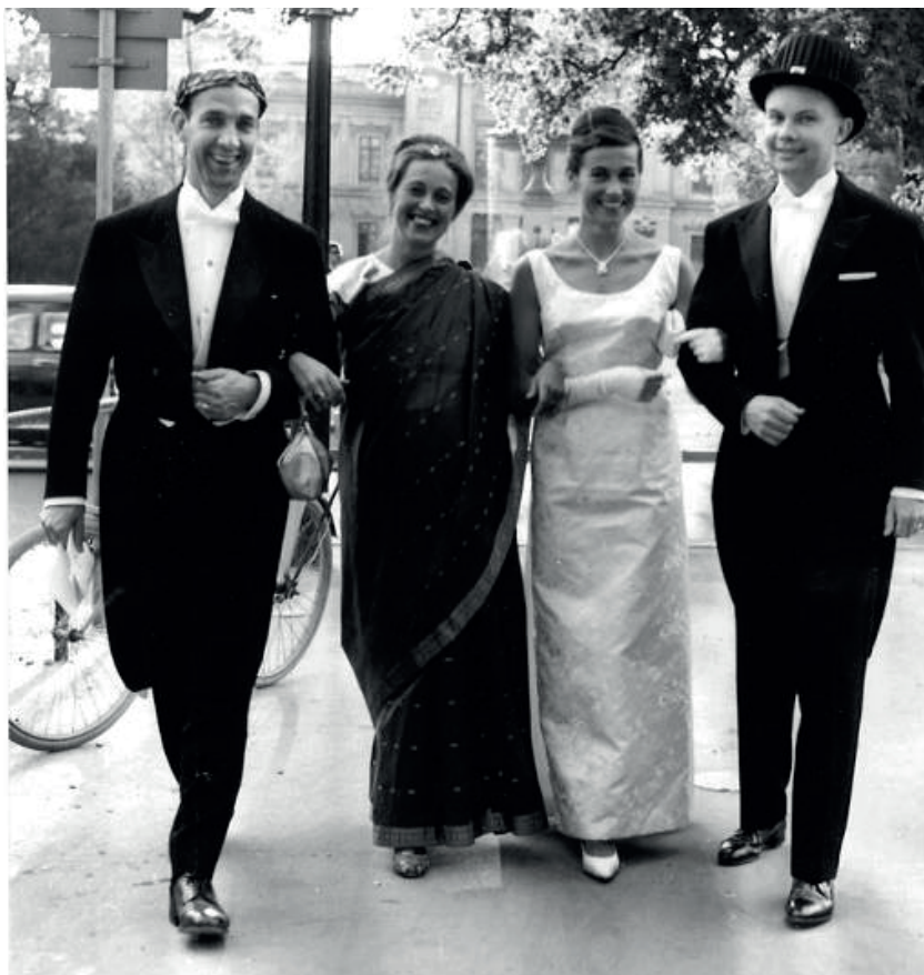
Doktorpromotion i Lund, 1963.