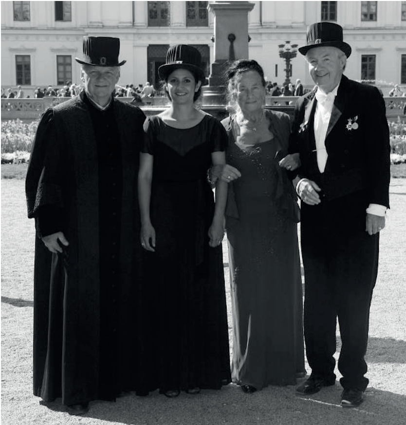
Jubeldoktorspromotion i Lund, 2013.

och ta första flyg över till USA. De bjöd på förstaklassbiljett. Jag åkte dit och förhandlade. Sedan hände inte så mycket mer. Man hade själva tillverkat en substans kallad t-PA (tissue plasminogen activator) som visade sig vara effektivare på koronartrombolys än våra peptider, men det var i alla fall en mycket