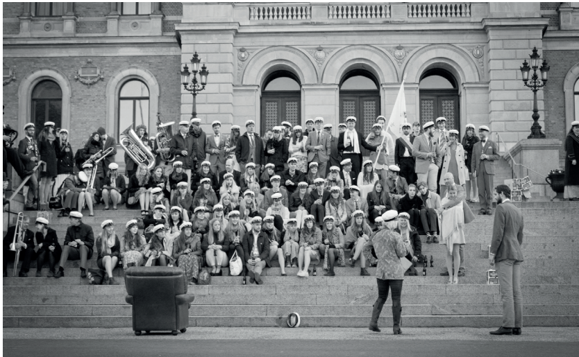
Det traditionsenliga majmiddagspexet hölls denna gång vid trappan utanför Universitetshuset.

Även detta år inföll valborg på sista april med ett soligt och vackert väder, dock något kallare än önskvärt. Det mesta var sig likt