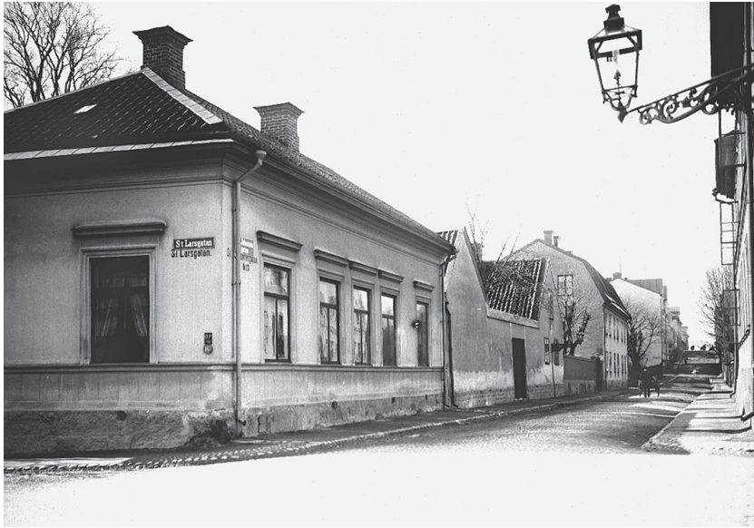
Alfred Dahlgren fotograferade S:t Johannesgatan vid sekelskiftet 1900. Till vänster byggdes Arkadien 1937, därefter ligger nr 15 som när det byggdes 1930 täppte till gaveln på Rosendalshuset vid Rundelsgränd.

radioprogram Vårat gäng, hängande i knäveckan från vår trapets. Greta hade utskänkningstillstånd vilket gjorde det möjligt för oss att låna vin under helgerna mot löfte, som aldrig bröts, att återställa ordningen på måndag morgon. På något sätt måste vi ha fått tid över för idog tentamensläsning, för vindsinnevånarna liksom flickorna på nedre botten, blev med tiden framgångsrika medborgare på tämligen höga poster i akademi, förvaltning, sjukvård, skola, rättsväsen m.m. Det ska dock inte förtigas att ett par kamrater gick under, men i båda fallen hade