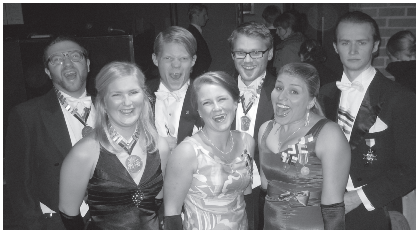
Ett gäng glada Snerikingar på besök i Lund.

Inspirerade och fulla av energi började klubbmästarna, recentiorsförmännen och de internationella sekreterarna förberedelserna inför höstens två recentiorsmottagningar och recentiorsgasque. Terminens torsdagsvärdar fick sitt traditionella elddop när en full festsal dukades upp två dagar i rad