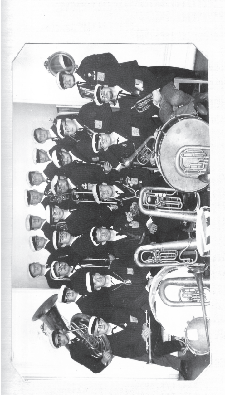
Hornboskapen tar ofta tillfället i akt att jublera. Här är ett foto från det bejublade 123-års jubileet.