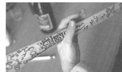
Vandringpriset - en segerad bandyklubba.

Som nämndes tidigare tog sig Södertälje SK till elitseriens slutspel för första gången på 14 år. Väl där drog man fulla hus på hemmamatcherna men åkte ut i semifinalen mot Färjestad. Det var dock