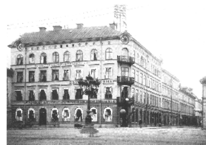
Dåtidens studenthotel på Svartbäcksgatan 2. Idag ett mordernare hus där bl.a. Duka huserar.