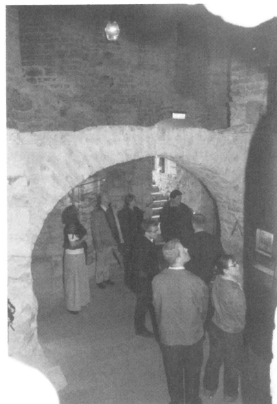
Hembygdsresan bjöd bl.a. på fängelsehållorna i Örebro slott.

En stekande het dag drog fem lag ut på SNally i trakterna kring Uppsala. Ett geografiskt mindre nogräknat lag hamnade snarare i trakterna kring Stockholm, med följderna att det blev fortkörningsböter både på vägen dit och tillbaka. Tidsramen är ju rätt knapp. Hela evenemanget avslutades i succéartad katastrof när ett av de tävlande lagen startade en ordinarie brasa på nationsträdgårdens gräsmatta med det bisarrt logiska argumentet "middagsdags!" som förevändning. Vi antog att de ville grilla korv. Lägereld blev det i alla fall, och klädstretch härs och tvärs kring päronsträd och bersäer.