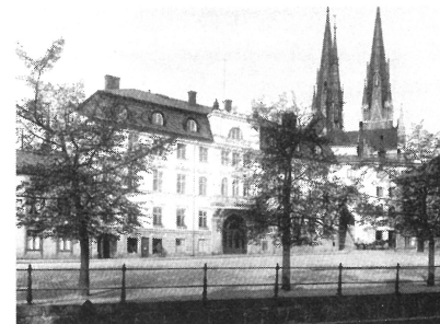
Hotell Gillet som det såg ut på 30-talet.

Krascher, kriminalitet, kriser fanns också i Ådals-Sverige. Luffare fanns, ATT HYRA stod i svart på vitt i lättlästa skyltar i många fastighetsportar, jämte den med "bettleri förbjuden", fast tiggare syntes dagligen på Kungsholmen och gårdsmusikanter lyfte på kepsen för nerkastade tidningsrivna myntpaket. Rolfs Nyårsrevy spelades som vanligt –om ett år var det slut även på den glädjen. Redaktör Artur Engberg skrev en ledare som hävdade att om någon stormakt ville ha Gotland som flygbas borde de få det, varpå han hotades med stämning av ilska ölännningar. Gunnar Ekelöf kallade sin debutsamling detta år "sent på jorden", tidslämpligt, även om tematiken var djupare suicidalpersonlig. Rättegången om Esarpsmordet började den veckan. På Värmdö, i en stuga vid Mörtån, i trakten av von Sydows som-