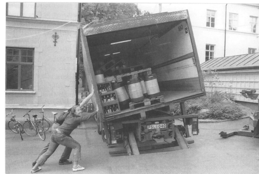
Två tappra nationsmedlemmar gör allt för att rädda nationshuset som håller på att puttas ner i Fyriskan