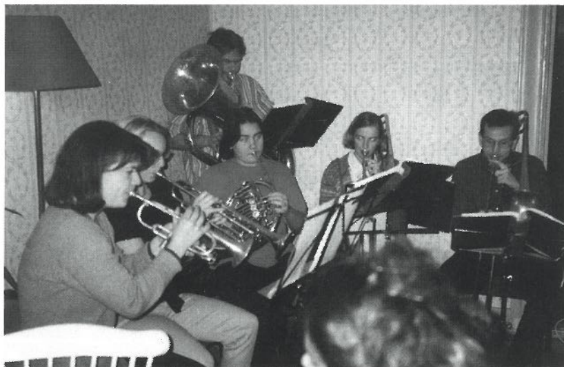
En sextett ur Hornboskapen bidrar till kulturpropagandan.

möte förlades till Backmanska där fiket intogs, innan man gick över till Stavenowska huset för själva mötet. Efter avslutat möte blev det rundvandring i det nästan färdigrenoverade huset.