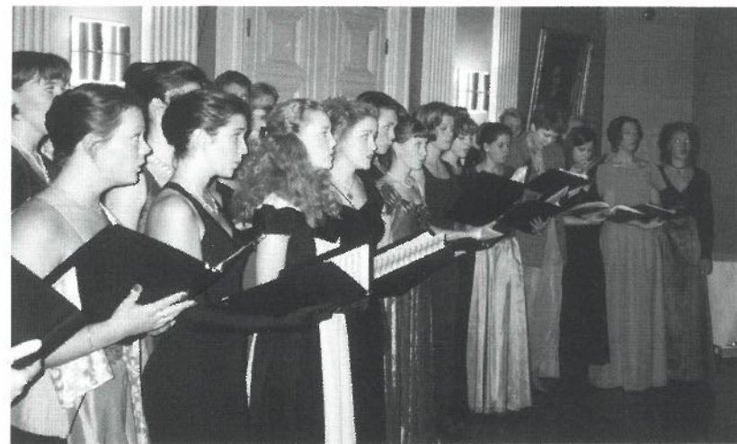
Sörmland-Närke kör pryder Stockholms nation.

De sittande klubbmästarnas stora problem under hösten blev att hitta lokal till de olika gasquerna. Allt tal – även om det förekom – att ställa in olika fester blev en omöjlighet då traditionen vägde tyngre. Därför riktades blickarna åter igen mot huvudstadens adept, då det blev dags för herrmiddag med frack. Tyvärr var uppslutningen från S-Nerikes något tunn vilket dock glädde oss som var där, då det fanns en servitris per två herrar. Den södermanlands-nerikingska traditionen på herrmiddagar att skicka snapsar med kryptiska meddelanden anammades alltför snabbt av stockholmarna, varför servitriserna till slut var tvungna att bryta tilltaget då de fruktade att ingen skulle överleva huvudrätten. Då de uppenbarligen underskattade oss kunde vi avnjuta hela kvällen under uppässning av de vackra damerna.