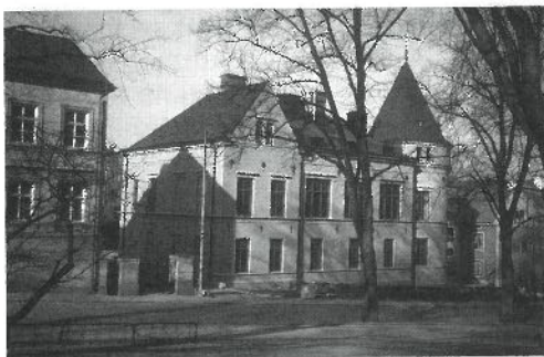
Nationshuset tolkat i bild av Anders Åman.

Därför är det självklart att det var 1800-talets slut och inte 1950-talet, som skapade den bästa arkitekturen och den mest stimulerande miljön för Uppsalas studentnationer.