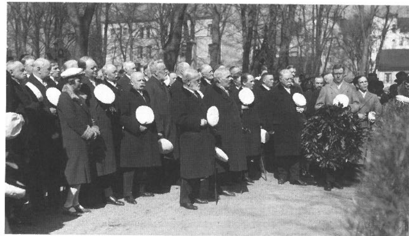
Kamratmötet 1927. Uppvaktning vid nationsgraven.