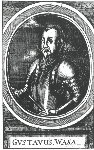
Titelsidan till en tidig tysk översättning av Gustave Vasa (1698).

Der Tapfere und verliebte GVSTAV von VASA, Der: Die Wunderwerk Der Liebe An den Nordischen Höfen; Welche unter des Tapfern und verliebten Gustavs von Vasa Wunder-vollen Le- bens-beschreibung / eine der artigsten und denckwürdigsten Liebes-Begebenheiten vorstellet. Allen Ehrliebenden Gemüthern zu vergön- ner Belustigung übergeben. Aus dem Französischen ins Deutsche übersetzt. Frankfurt und Leipzig/ Verlegt bey Rudolph Johann-Deimers-Buchhändler. Anno 1698.