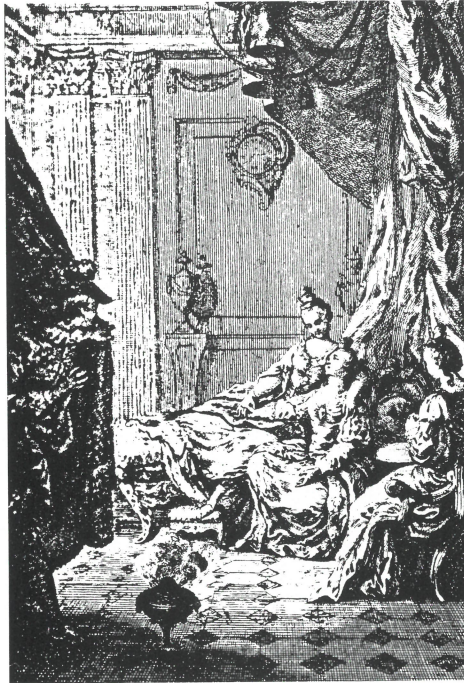
”En kväll besöker Gustav oanmäld sin syster Cecilia och vem träffar han där om inte prinsessan av Södermanland! Illustration till omtryck av Gustave Vasa , 1725, ingående i La Bibliotheque de Campagne . (Kungl. Bibl., Stockholm).

dottern till herren till Loholm. Vid hennes sida njuter han sedan lyckan av ett långt och fridfullt liv.