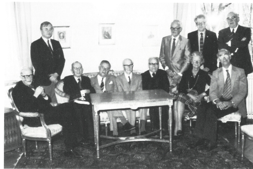
1982 års kamratmötes hedersämbetsmän.

Efter julens välsignelser förberedde sig Nationen inför en intensiv vårtermin. Andre kurator hårdtränade inför Vasaloppet genom att de-