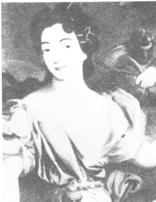
Charlotte-Rose de Caumont La Force

”blygsamma blickar”. Detta hindrar honom dock inte från att fortsätta sin förbindelse med kurtisanen Sigibrite, ”den oblygaste kvinna som någonsin levat.” Välvande mörka planer återvänder han till Danmark, fast besluten att sätta dem i verket.