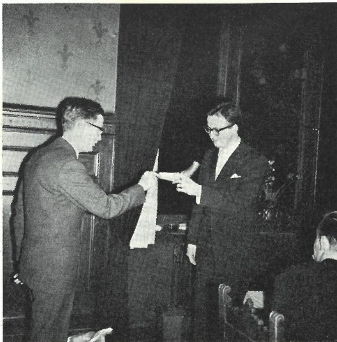
Förste kurator mottager det Mårtengrenska ritualhornet ur altaché Mårtensons hand.

av den akademiska miljöns centrum kring universitetsparken. I denna ensemble spelar det naturligtvis inte samma roll som t. ex. Gustavia-num, men vi kan konstatera att det på ett osökt och lyckligt sätt passar in i sitt sammanhang och hävdar sig förvånande väl som sentida komplement till sin historiemättade omgivning.