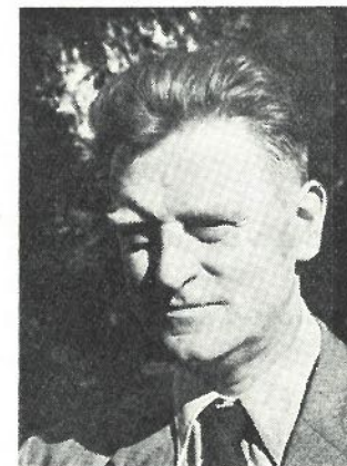
Tonsättaren Dag Wirén.

seniorer. För att i någon mån lätta klubbmästarinnans ökade arbetsbörda inrättades vid samma tillfälle en biträdande klubbmästarinnebefattning.