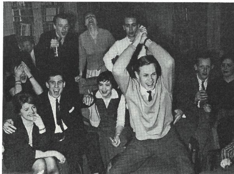
En ögonblicksbild från yttre biblioteket under Ingo-vakan.

I skrivande stund kan konstateras, att den hittills förflutna delen av vårterminen varit av stillsammare art. Julgransplundring den 10 januari