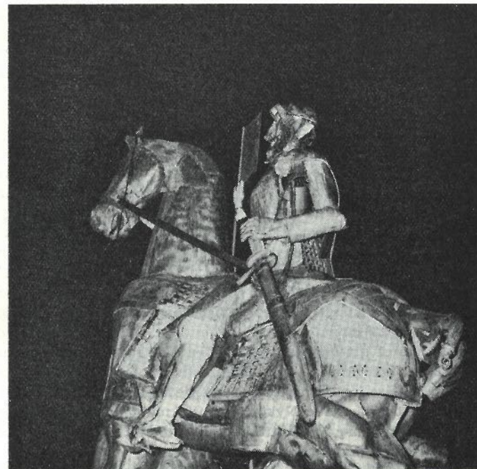
Sömmland-närkingarnas ryttsstaty efter avtäckningen.