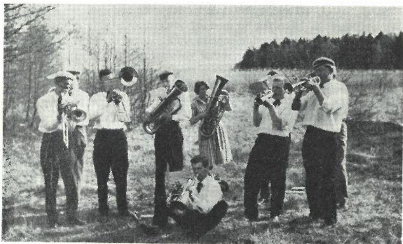
Hornboskapen med kvinnlig förstärkning konserterar i det gröna.

Mången här runt dessa borden väntar nu, att stolta orden äntligt sagda bleve de. Så skall ske: Sörmland, Närke, leve de!»