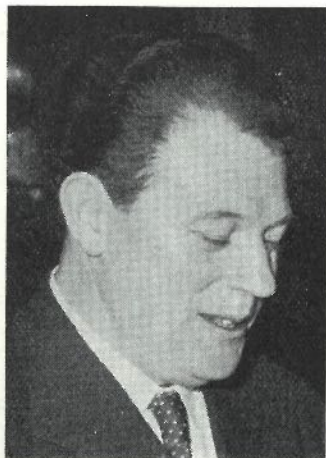
Författaren Harry Martinson.

bevittna kraftmätningen mellan Ingo och Floyd. När de hela väl kom igång, vaknade livsandarna — till glädje för den påpasslige nationsfotografen, som studerade publiken mer än rutan med å föregående sida publicerade resultat.