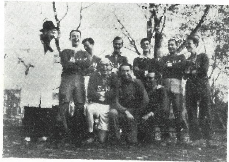
Seniorernas segrande lag.

Försommaren var varm och blev ur utrikespolitisk synpunkt ovanligt händelserik. Bastiljstormningen, som inställts föregående år, firades nu åter med sedvanlig intensitet. Värden av nationen låg i händerna på en rad med täta intervall skiftande prokuratorer, men trots detta befann sig nationen i god ordning då landsmännen vände åter till staden.